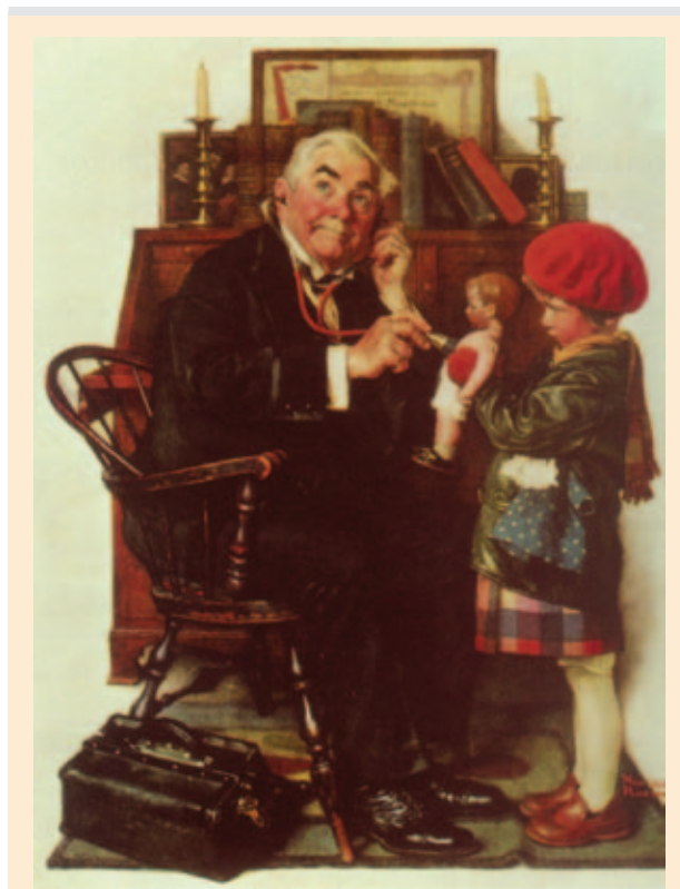
Norman Rockwell (1929): Il dottore delle bambole (© Norman Rockwell Entities).